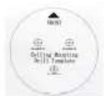
Plantilla de perforación Equipo de resistencia al agua